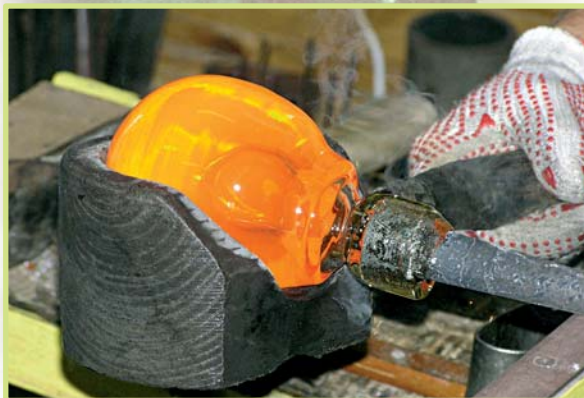
Muzeja stikla darbnīcā

Viss muzeja kompleksa pirmais posms ir izveidots ar Uzņēmējdarbības Attīstības Fonda un Igaunijas Republikas Kultūras ministrijas atbalstu.