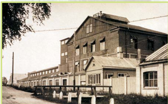
Stikla rūpnīca 1930

Jārvakandi Stikla rūpnīca ir dibināta 2000. gadā kā municipālais muzejs.